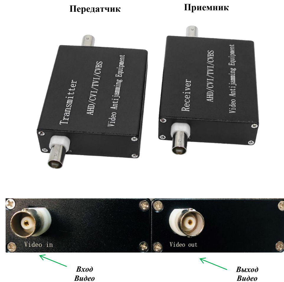
Рисунок 3. Приемник и Передатчик. Внешний вид 2.

Внимание! Монтаж и подключение устройства производить только при отключенном питании.