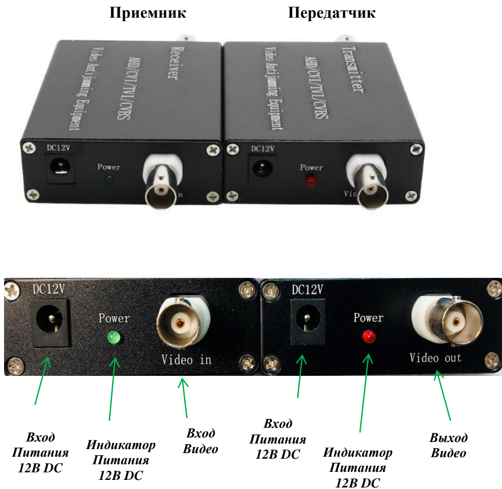
Рисунок 2. Приемник и Передатчик. Внешний вид 1.

4.3. Внешний вид блоков, расположение индикаторов, элементов коммутации и их назначение приведено на Рисунках 2 и 3.