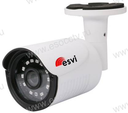
Руководство по быстрой настройке

Благодарим Вас за выбор нашего оборудования. Пожалуйста, перед использованием оборудования внимательно прочитайте данное руководство. Все программное обеспечение, необходимое для работы с оборудованием, Вы можете скачать с сайта esocctv.ru .