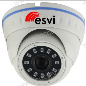
Руководство по быстрой настройке

Благодарим Вас за выбор нашего оборудования. Пожалуйста, перед использованием оборудования внимательно прочитайте данное руководство. Все программное обеспечение, необходимое для работы с оборудованием, Вы можете скачать с сайта esocctv.ru .